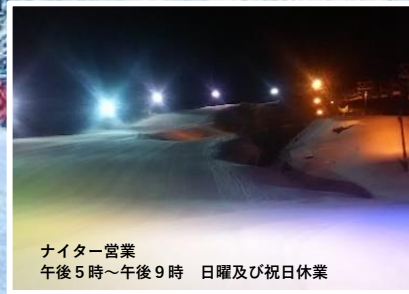
ナイター営業 午後5時～午後9時 日曜及び祝日休業

山頂から小国盆地と朝日連峰の雄姿を一望！ 天然雪 100%！ 初心者から上級者、ファミリーにもやさしいゲレンデ！