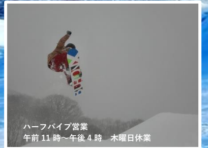
ハーフパイプ営業 午前11時～午後4時 木曜日休業