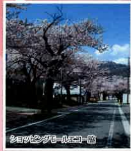
道の駅「白い森おぐに」