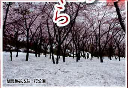
飯豊梅花畑 桜公園

町内の桜の状況等は、小国町観光協会のブログ・Facebookからご確認いただけます。