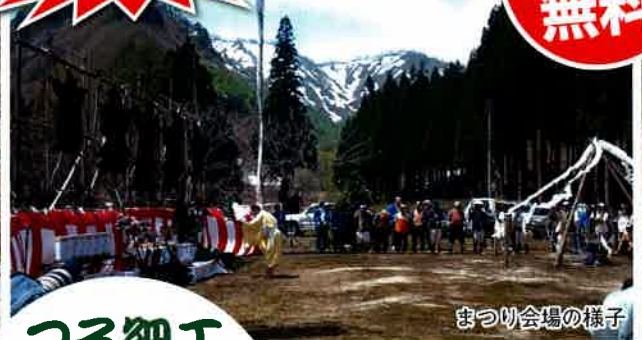
まつり会場の様子