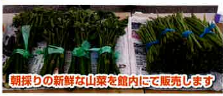
朝採りの新鮮な山菜を館内にて販売します